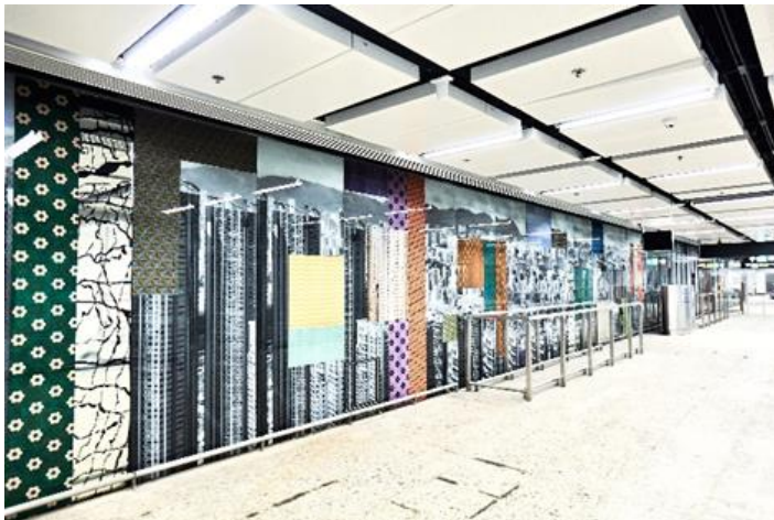
站內藝術品 [牆上的景像]